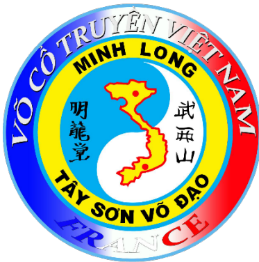
Association MINH LONG FRANCE