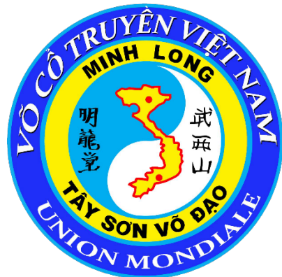
Union Mondiale MINH LONG